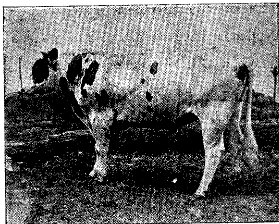
MATADOR ROUBLE FERN

PERITO AGRICOLA DE LA ESCUELA DE AGRICULTURA DE GUATEMALA, CENTRO AMERICA