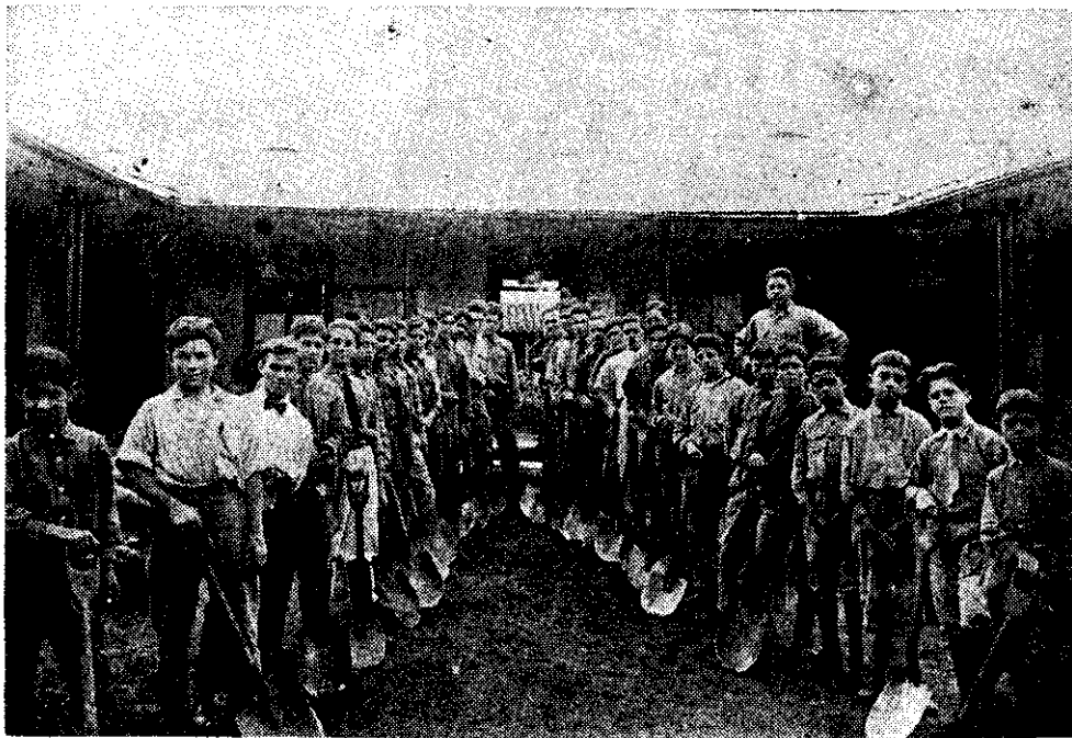
ALUMNOS DE LA ESCUELA DE AGRICULTURA DE COSTA RICA EN 1919 LA PALA ES EL SIMBOLO DEL HOMBRE AMANTE DE LA TIERRA Y DEL TRABAJO

PERITO AGRICOLA DE LA ESCUELA DE AGRICULTURA DE GUATEMALA, CENTRO AMERICA