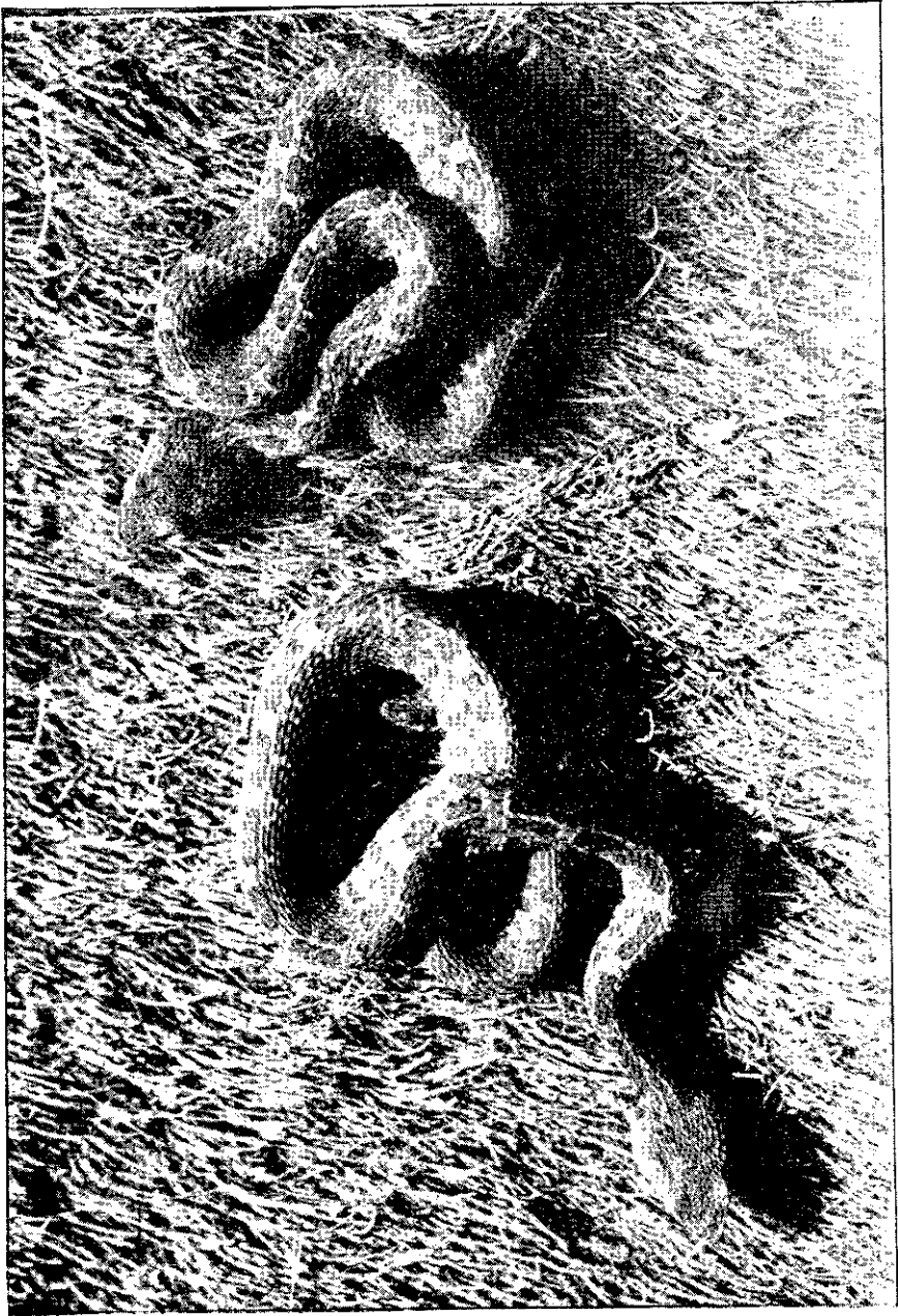
Fotografía tomada por el autor, de 2 ejemplares de culebra Lora ( Bothrops lateralis ), con la que jugaban dos niños en la Estación del Ferrocarril en Orotina. Fueron capturadas después por el mismo y traídas a los viveros del Dr. Picado.