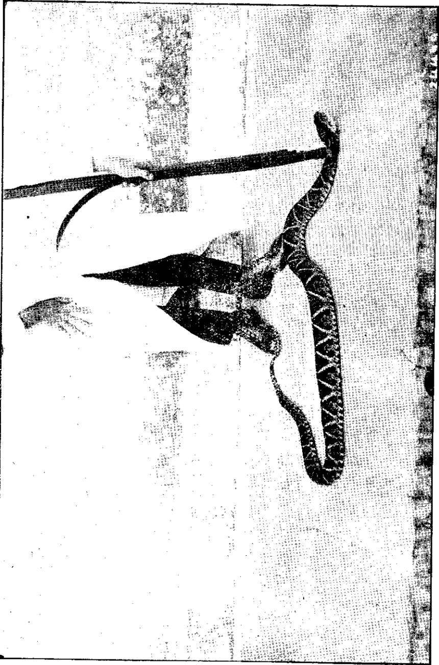
Puede apreciarse en el grabado la forma cómo se sujeta una serpiente para evitar la mordedura.