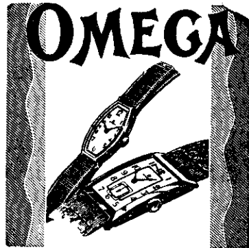
EL MEJOR RELOJ JOYERIA MULLER San José, C. R. - Avenida Central

cia entre las semillas de 15 a 20 centímetros. Generalmente son necesarios de 14 a 16 kilos de semilla para un terreno compuesto de 100 surcos legumbreros. La jícama más desarrollada es la que se siembra en el mes de marzo y se cosecha de setiembre en adelante. Siendo en Costa Rica más cálida la temperatura ambiente puede darse una idea de cuál ha de ser la forma mejor para el cultivo de la jícama".