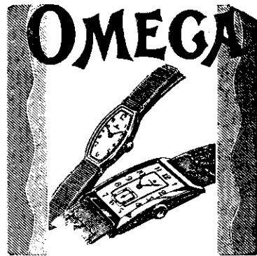
EL MEJOR RELOJ JOYERIA MULLER

Las garantías sociales, que el Dr. Calderón Guardia ha dado a su pueblo, son verdadera obra de Gobernante. Debemos estar con las Garantías Sociales y en contra de aquellos que trabajan por destruirlas.