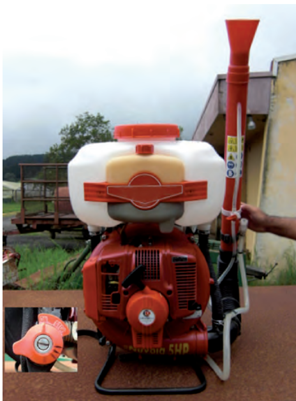
Figura 1. Vista trasera de la bomba de motor utilizada para la distribución de semillas forrajeras de alpiste ( Phalaris canariensis ) y linaza ( Linum usitatissimum L.). Cartago, Costa Rica. 2010.

equipo posee una perilla de apertura de la tolva o tubo de descarga, graduado en diez puntos o niveles de descarga (Figura 2) se emplearon tres niveles o grados de apertura: 4, 6 y 8.