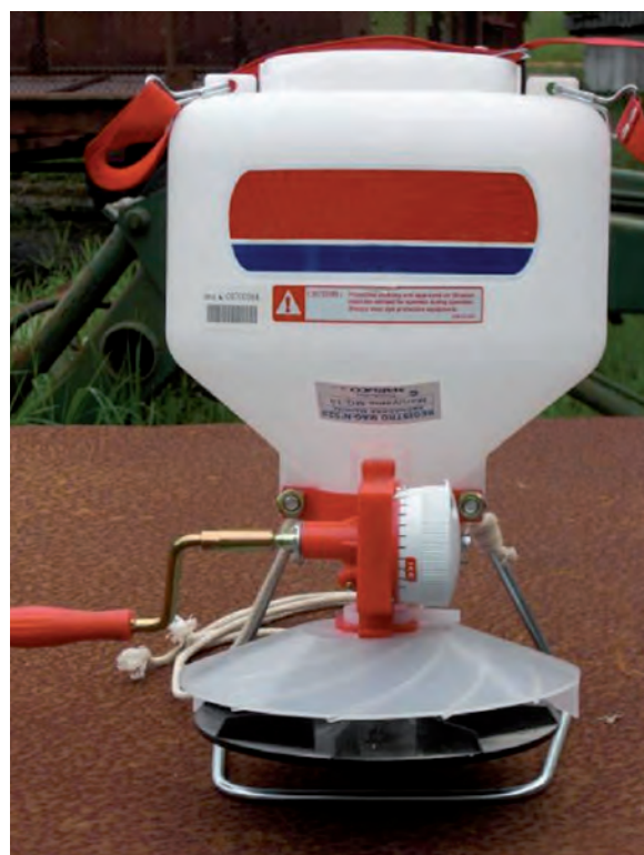
Figura 2. Vista frontal de la voleadora manual utilizada para la distribución de semillas forrajeras de alpiste ( Phalaris canariensis ) y linaza ( Linum usitatissimum L.). Cartago, Costa Rica. 2010.

También hubo un entrenamiento del operario para que la manija de voleo diera un giro a razón de una